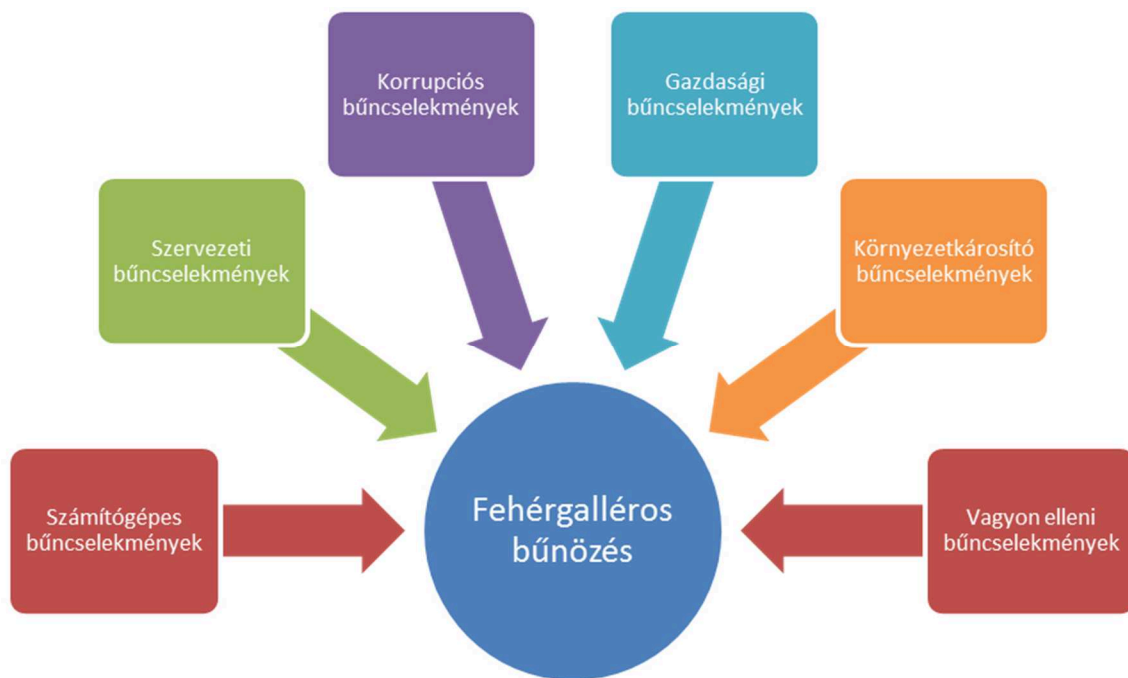
1. számú ábra A fehérgalléros bűncselekmények főbb típusai

A fehérgalléros bűnözés és a korrupció kapcsolatrendszerét, vagyis a korrupciós tranzakciókban résztvevők hálózatát az alábbi gráfon ábrázoltam (lásd 2. számú ábra).